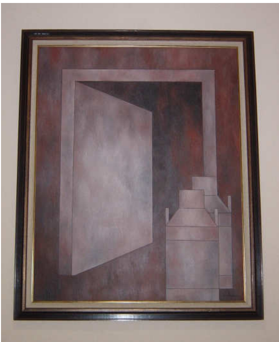
De nieuwe dag ontluikt