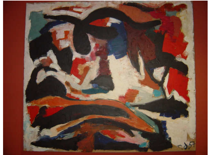
La fête au village

Schilder, tekenaar. Vestigde zich in 1950 met zijn ouders te Blankenberge, in 1961 te Oostende. Autodidact. Evolueerde van lyrische abstractie over pop art naar een tot de essentie herleide en uiterst persoonlijke figuratie, die vaak op de rand van de abstractie balanceert. "Versplinterde, gefragmenteerde of zeer schetsmatig uitgewerkte figuren, paren en groepen roepen een sfeer op van bevreemding, vervreemding of morbiditeit". (Lexicon II) Zijn werken getuigen van een vrije, onconventionele en poëtische visie. Prijs van de Jonge Belgische Schilderkunst in 1961. Werk o.m. in de Musea te Oostende, Luik en Brussel. Vermeld in het "Lexicon van Westvlaamse Beeldende Kunstenaars II", BAS I en III.