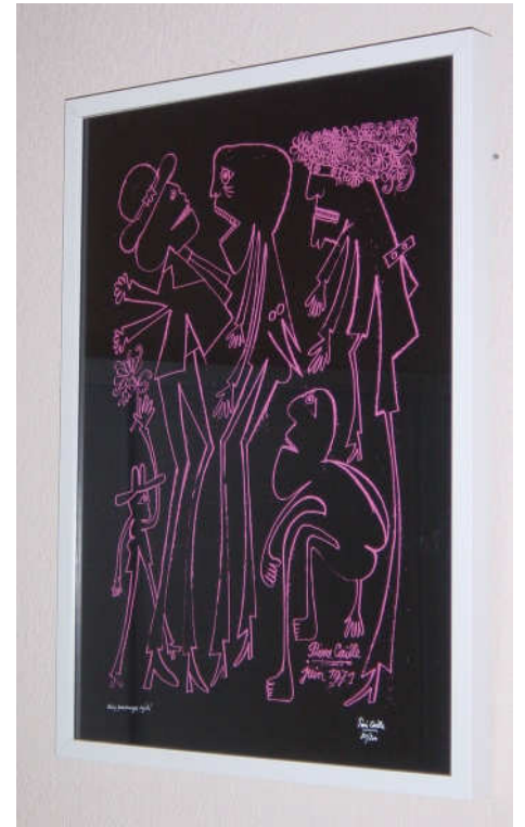
Cinq personnages agités