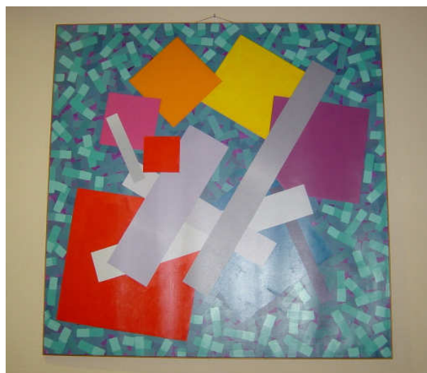
Nias Snail II

Schilder, graficus. Opleiding aan de Academie te Gent (1959-1964). Abstract constructivist. Debuteerde met structuren die optische effecten inhielden. Kwam tot een geometrische vormgeving waarin uiteindelijk ook enkele symbolistische of figuratieve elementen opdoken. Prijs van de "Jong Belgische Schilderkunst" in 1968, xamenmet W. Plompen. Werd leraar aan de Academie te Gent. Werk o.m. in de Musea te Deurle, Gent, Oostende.